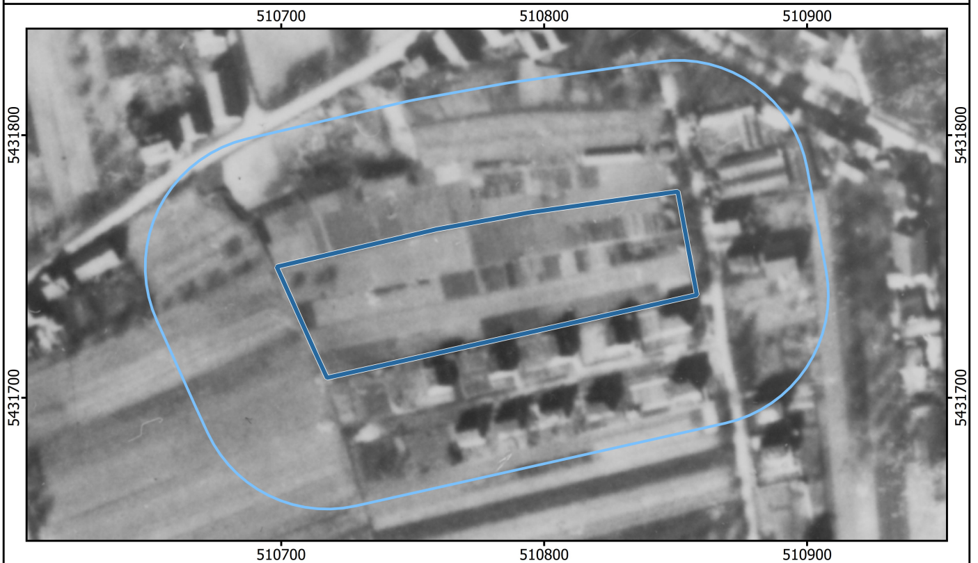
Ausschnittvergrößerung eines Luftbilds vom 19.03.1945.